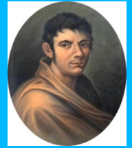
Città di Francesco Lomonaco