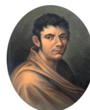
Città di Francesco Lomonaco