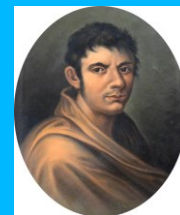
Città di Francesco Lomonaco

CITTA' DI MONTALBANO JONICO Provincia di Matera UFFICIO ALBO PRETORIO INFORMATICO www.comune.montalbano.mt.it