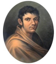
Città di Francesco Lomonaco

CRON. N. _____ / _____ Registro delle Pubblicazioni all' Albo Pretorio Informatico