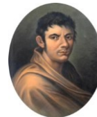
Città di Francesco Lomonaco