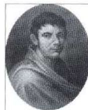
Città di Francesco Lomonaco