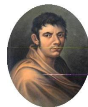
Città di Francesco Lomonaco