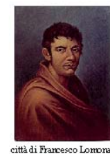
città di Francesco Lomonaco

Regione Basilicata COMUNE DI MONTALBANO JONICO Provincia di Matera