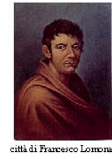
città di Francesco Lomonaco

Regione Basilicata COMUNE DI MONTALBANO JONICO Provincia di Matera